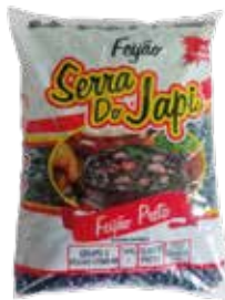
|FEIJÃO PRETO SERRA DO JAPI