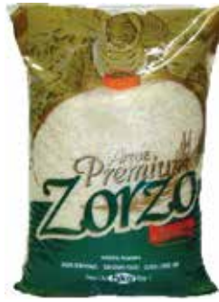
|ARROZ PREMIUM ZORZO