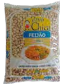
|FEIJÃO VOVÓ CHICA