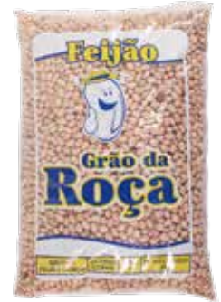
|FEIJÃO GRÃO DA ROÇA