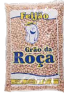
|FEIJÃO GRÃO DA ROÇA