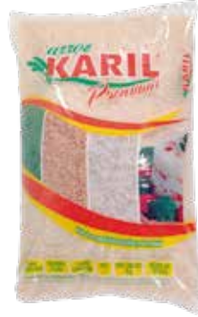
|ARROZ KARIL PREMIUM