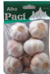
|CARTELA DE ALHO PACI