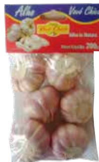
|CARTELA DE ALHO VOVÓ CHICA