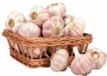
|ALHO A GRANEL