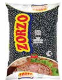
|FEIJÃO PRETO ZORZO