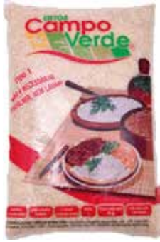
|ARROZ CAMPO VERDE