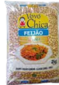
|FEIJÃO VOVÓ CHICA